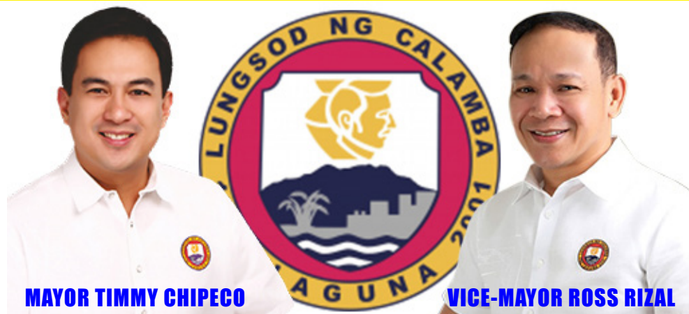
MAYOR TIMMY CHIPECO